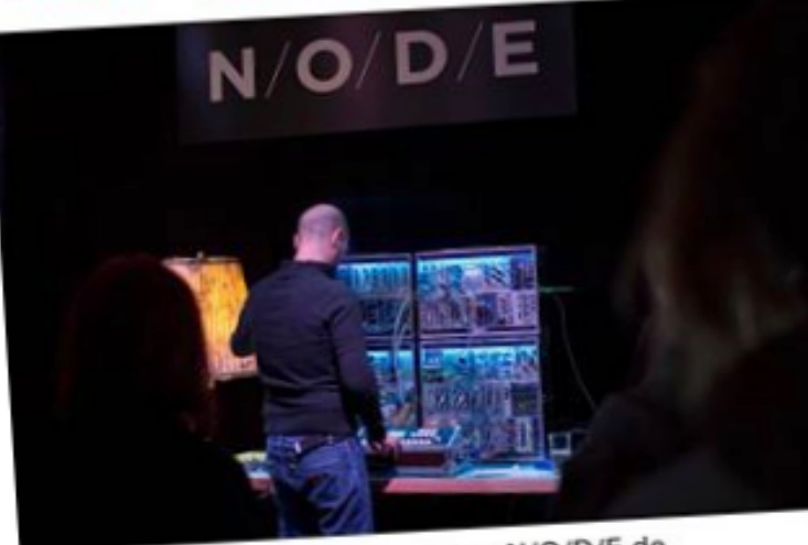
Live modulaire de Boodaman au N/O/D/E de

Liberation ∞ 100 CINÉMA + MUSIQUE + LIVRES + SCÈNES